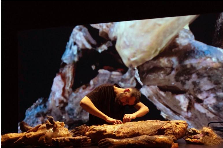
Abb. 9: Arkadi Zaides: Necropolis © Eike Walkenhorst.

thrust aside in order to live.« 31 Wenn Forensik laut Eyal Weizman die Art und Weise bezeichnet »by which the present theatre of horrors is performed by objects in front of a public« 32 , dann scheint in Zaides' forensischer Ästhetik jenes »present theatre of horrors« durch eben diese abjekten Körper performt zu werden.