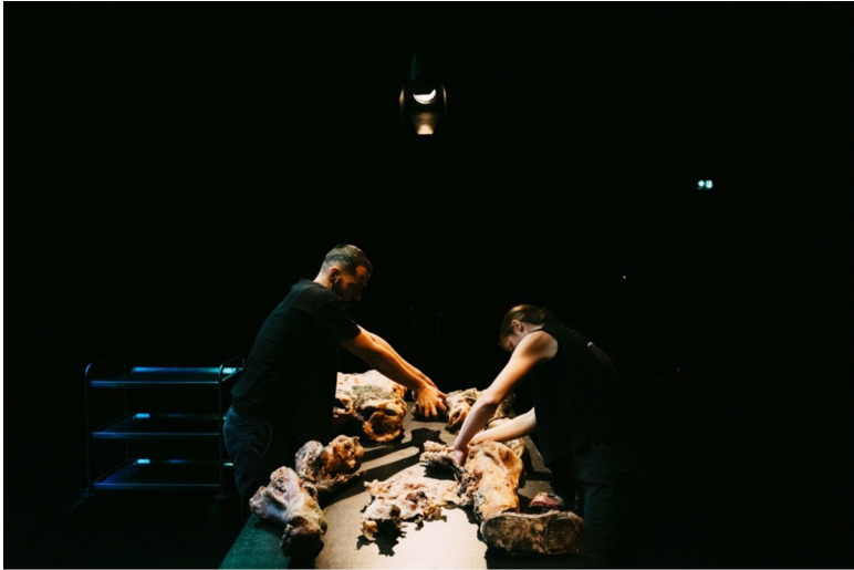
Abb. 8: Arkadi Zaides: Necropolis © Eike Walkenhorst.

Was heißt es nun genau, wenn Zaides die Vorgehensweise in Necropolis als das Performen eines forensischen Rituals beschreibt? Da ist zum einen das festgelegte »choreografische Protokoll«, das dem Rechercheprozess nach den Grabstätten zugrunde liegt und vorgibt, wie an den verschiedenen Orten in ganz Europa das Sich-Annähern an diese dokumentiert werden soll: »Sobald wir lokalisiert haben, wo die Körper entsorgt wurden, besuchen wir die Grabstätten und performen nach einem festgelegten, choreografischen Protokoll ein Ritual.« 30 Es sieht vor, sich auf spezifische Weise zu bewegen und, wie bereits beschrieben, den Weg zum Grab auf festgelegte Weise mit dem Smartphone zu filmen, um es in die virtuelle Datenbank von Necropolis aufzunehmen. Das dokumentarisch-choreografische Ritual ermöglicht in der spekulativen Erzählung also den anonymen Toten allererst den Eintritt in die