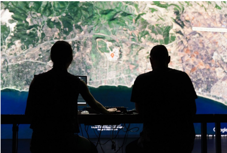
Abb. 6: Arkadi Zaides: Necropolis © Eike Walkenhorst.

In diesem Fall ist es das Studio Bagouet / Agora in Montpellier. Langsam wird herausgezoomt, gesteuert durch die Laptops des Regisseurs Arkadi Zaides und der Choreografin Emma Gioia, die nur schemenhaft zu erkennen sind. 4 Das Dach des Gebäudes wird sichtbar, dann die Umgebung, die Stadt, ihre Ausläufer, die Küste bis schließlich ein roter Pin mit der Bezeichnung »Daouda Bah« zu sehen ist. Dort hält die Bewegung inne und zoomt wieder heran, immer weiter, bis wir die genauen GPS-Koordinaten sehen und folgende Informationen lesen können: »Found dead: 17. Feb. 2017 / Name: